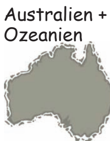
Australien + Ozeanien